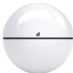
AMPERE SPHERE 3 kWh

¿Qué son las baterías inteligentes y por qué Ampere? Equipo Ampere: garantías y manual de montaje Argumentario de ventas y casos de éxito Legalización de instalaciones