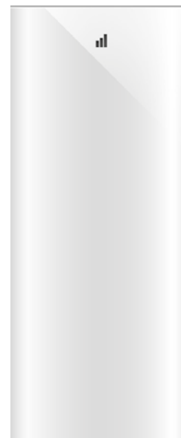
AMPERE TOWER 9 / 12 kWh